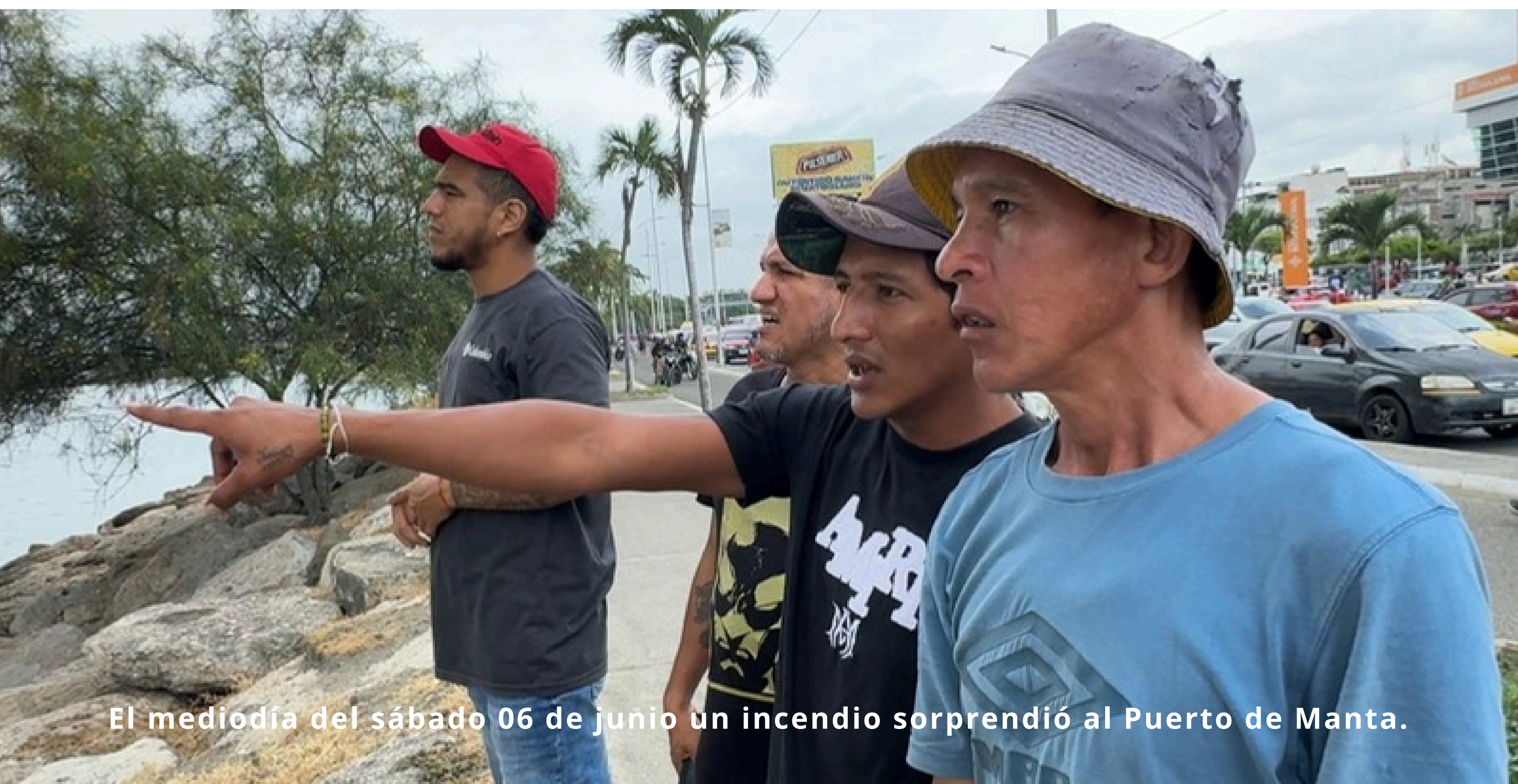
El mediodía del sábado 06 de junio un incendio sorprendió al Puerto de Manta.