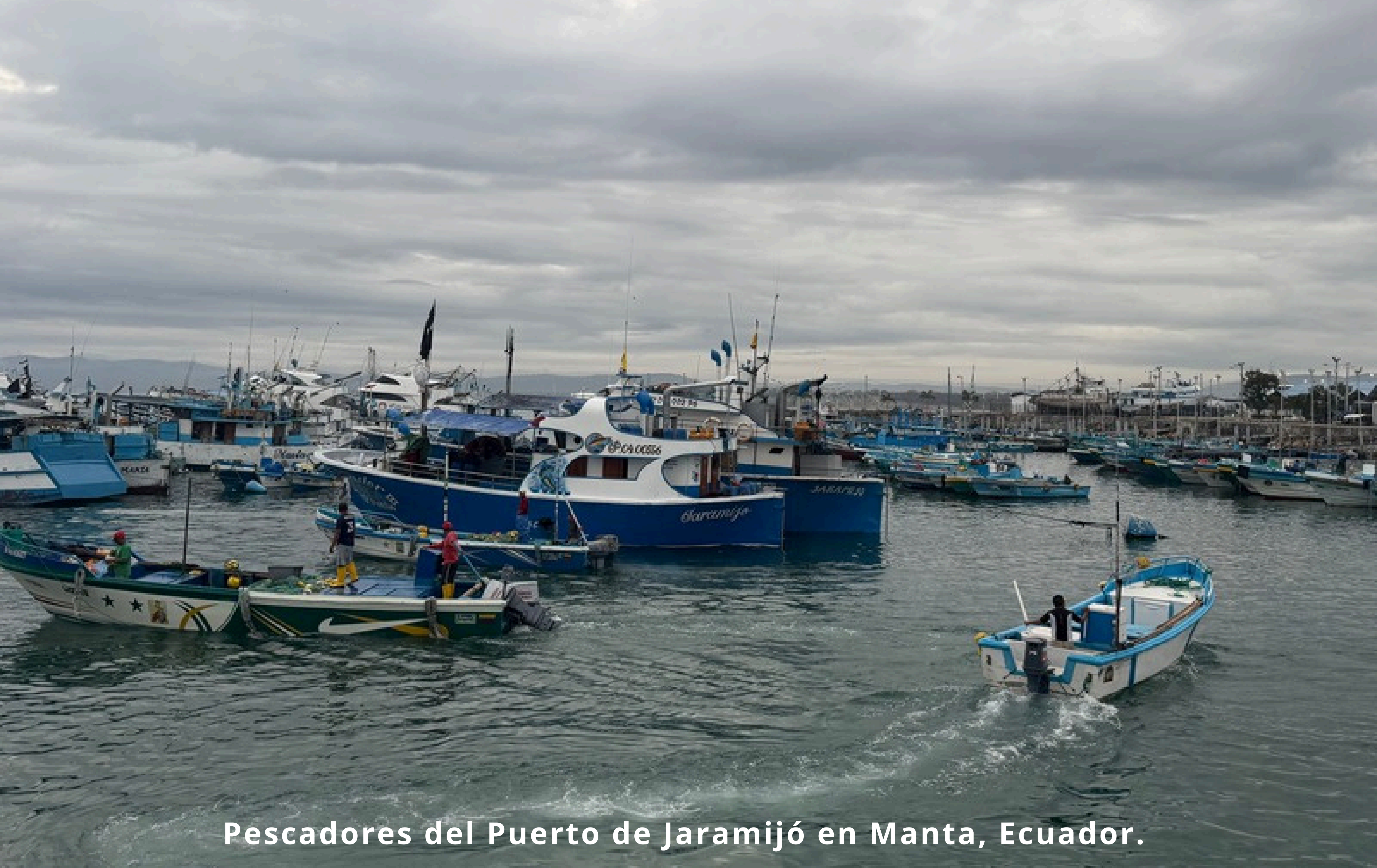
Pescadores del Puerto de Jaramijó en Manta, Ecuador.