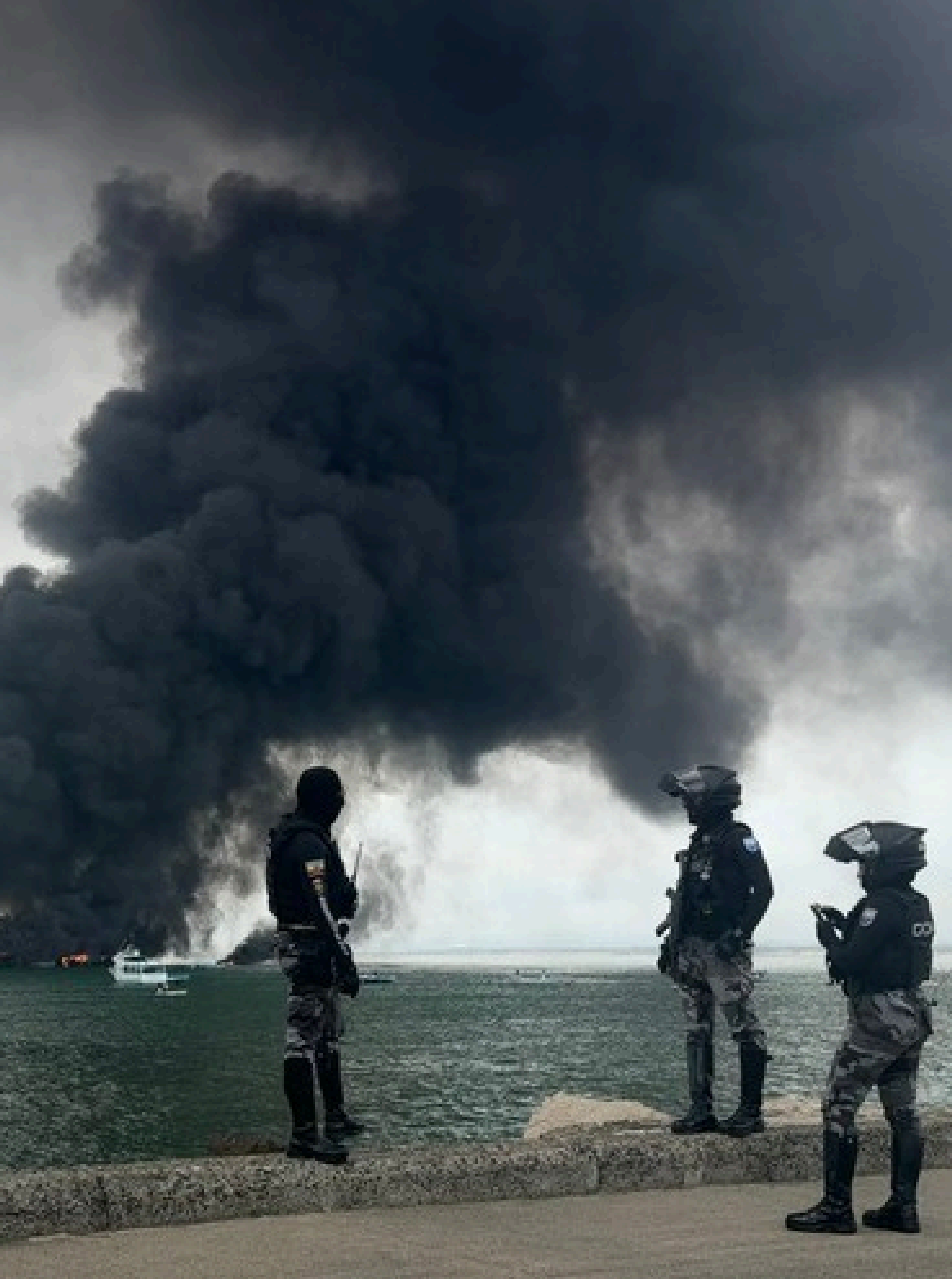
El incendio en el puerto de Manta inició antes del mediodía del 06 de junio.